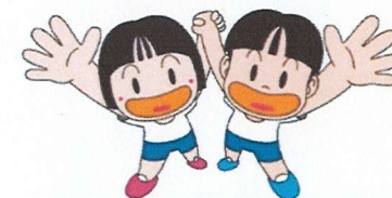
サトスポ マスコットキャラクター